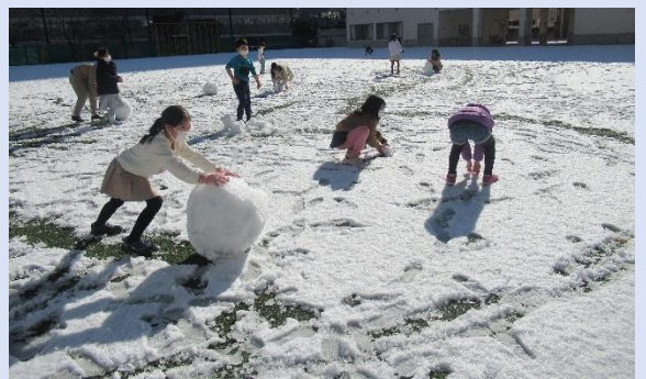
ゆきあそび 大雪の次の日。大きな雪だるまを作りました！