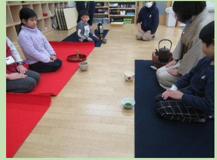
はじめてお茶を点てました。