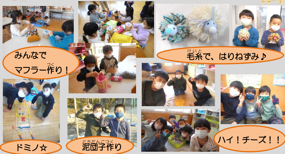
みんなでマフラー作り！