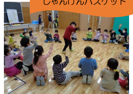
じゃんけんバスケット