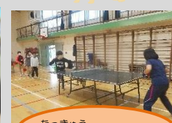
たつきゅう卓球タイム