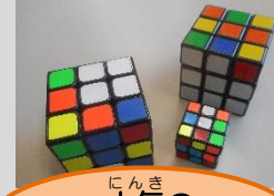
にんき人気のルービックキューブ