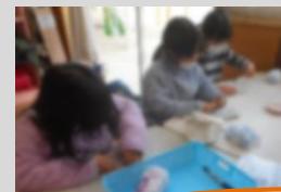
あみあみ隊『コースター』