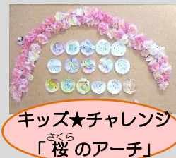
キッズ★チャレンジ 「桜のアーチ」