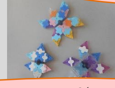
にんき 人気のラキュー！コマを作るのが流行っています！