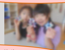
にんき 人気のラキュー！コマを作るのが流行っています！