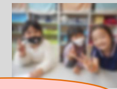
みんなでハイチーズ！！