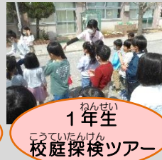
ねんせい 1年生 こういてんけん 校庭探検ツアー