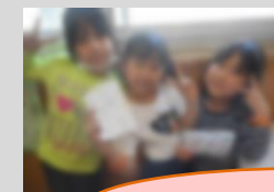
みんなでハイチーズ！！