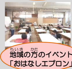
ちいきかた 地域の方のイベント 「おはなしエbron」