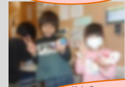
にんき 人気のラキュー！コマを作るのが流行っています！