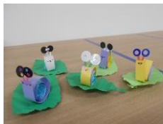
REクラフト(でんでんちゃん)