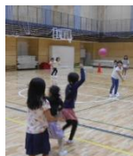
みなジョイ「マッスル大会」