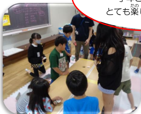
～めんこ大会～ 学年ごとで対決！！ とても楽しんでいました。