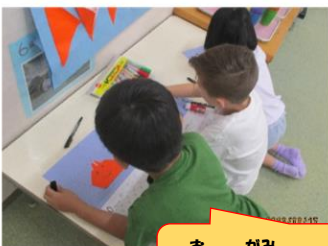
折り紙カレンダー