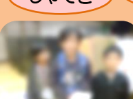
だからお宝めいろ