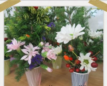
みんなが生けるお花はいつもステキ!!