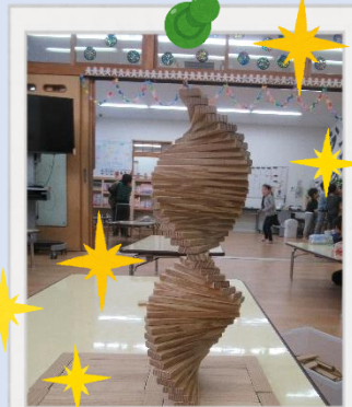
今月のカズラ作品