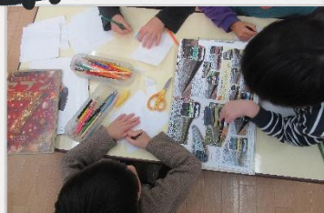
オリジナルペーパークラフトが大人気!