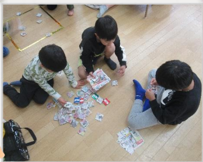
大フームのメンコ! たくさん作っています!